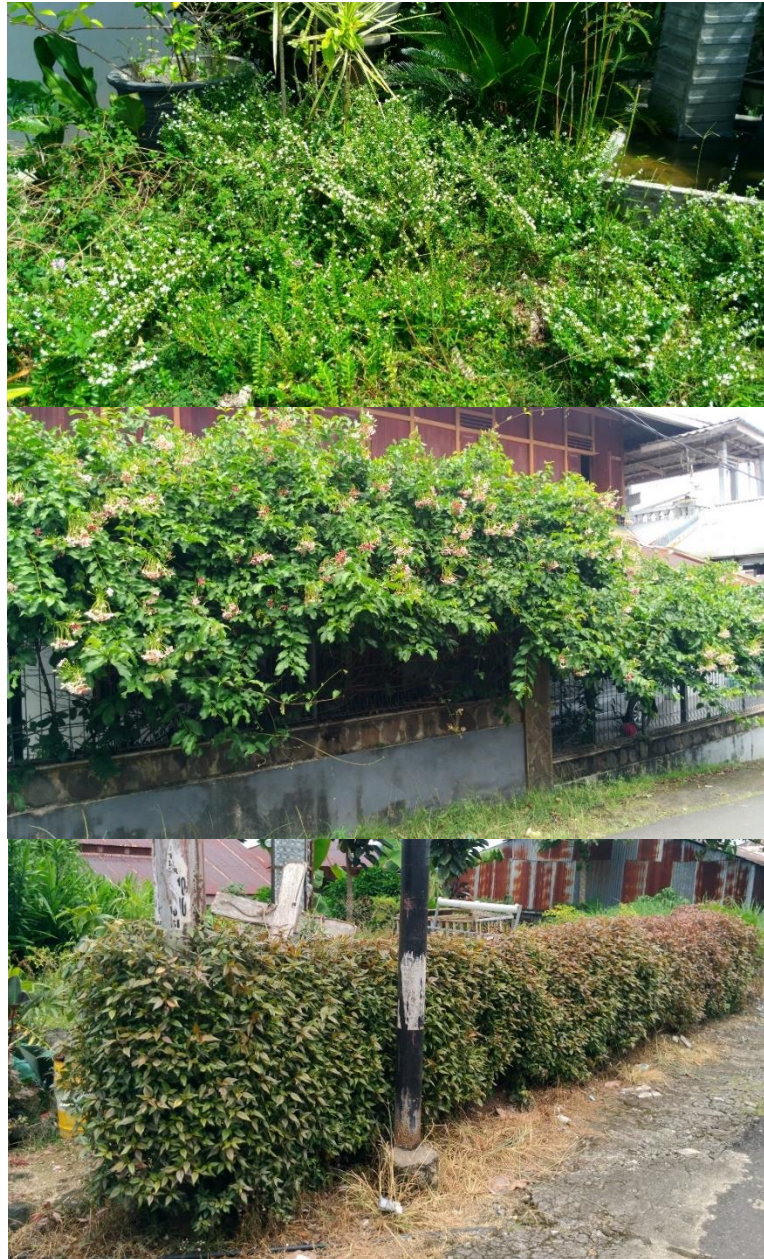
Gambar 2. Kecenderungan Penyeragaman Tanaman di RTH Pemukiman Winangun Dua Lingkungan 1 dan Lingkungan 3