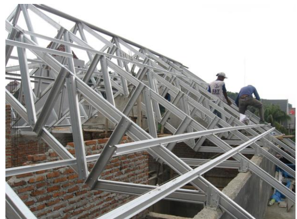
Gambar 1.1. Konstruksi Atap Seng Berbasis Baja Ringan

Konstruksi bangunan rumah/garasi dengan atap seng, membuat gantungan baju, lemari dan rak sepatu berbasis baja ringan ditunjukkan pada gambar 1.1-1.6.