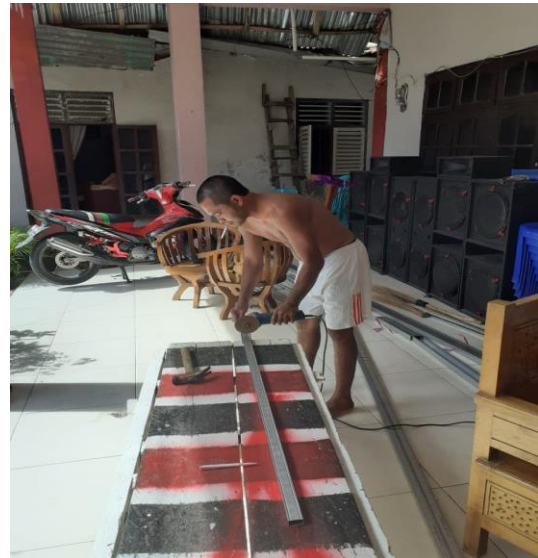
Gambar 3.10. Peserta pelatihan melakukan pemotongan taso (baja ringan) dengan menggunakan pemotong elektrik. Untuk tiang dengan panjang 1,48 meter, dan 120 cm.