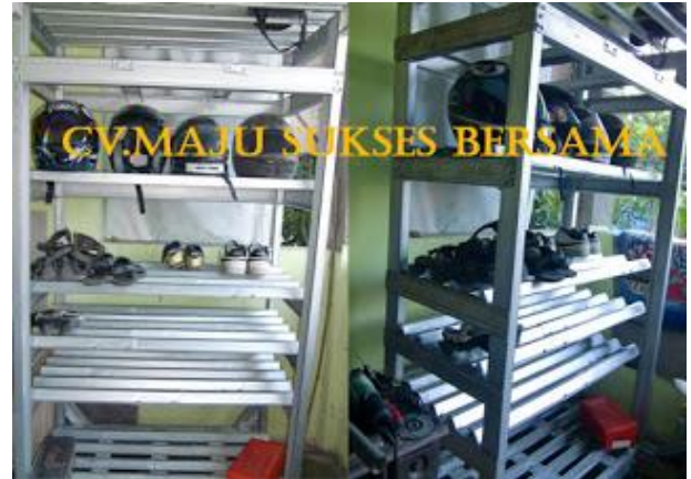
Gambar 1.6. Rak sepatu

Dalam rangka untuk membantu peningkatan pengetahuan dan ketrampilan masyarakat-tukang tentang disain dan konstruksi bangunan dengan atap seng membuat gantungan baju, lemari dan rak sepatu berbasis baja ringan maka sangat diperlukan intervensi Perguruan Tinggi Universitas Negeri Manado dengan program pengabdian masyarakat disamping dalam rangka aplikasi ilmu pengetahuan tetapi juga untuk memberdayakan masyarakat-tukang sehingga mereka boleh memperoleh pendapatan yang cukup untuk penghidupan keluarga. Pengusul proposal ini sebagai dosen Unima terpanggil dalam memberikan kontribusi nyata memecahkan masalah berkaitan dengan pengetahuan dan ketrampilan tenaga kerja lokal.