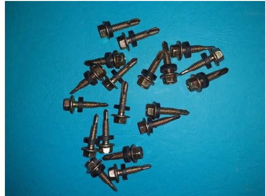
Gambar3.4.c. Paku untuk tiang dan sambungan.