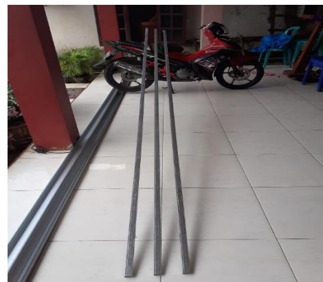
Gambar 3.2. Bahan baja ringan dengan tipe CBM Hollow 16x32 yang telah disiapkan untuk kegiatan PPM