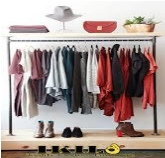
Gambar 1.2. Gantungan baju