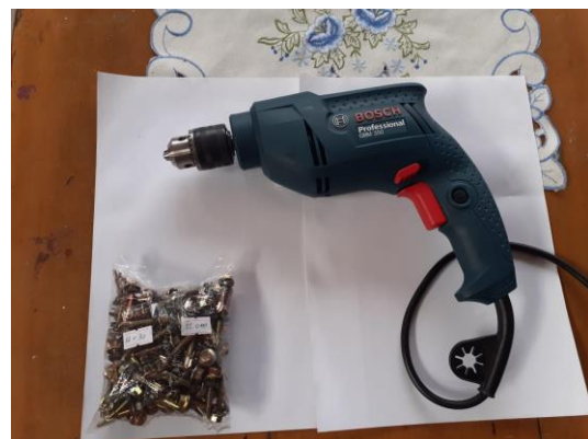
Gambar 3.5d. Bor listrik