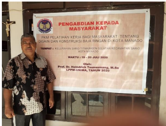
Gambar 3.7. Pengabdi memberikan penjelasan maksud kegiatan PPM