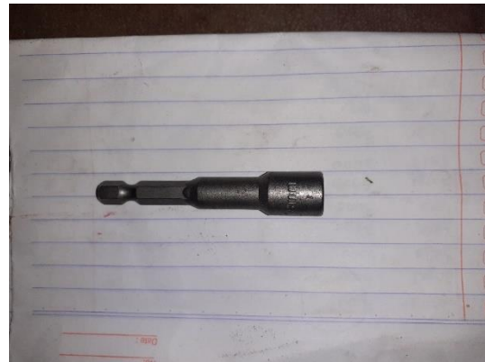
Gambar 3.4d. Komponen pemutar bor