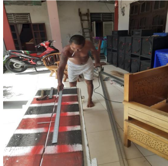
Gambar 3.9. Peserta pelatihan melakukan pemotongan taso (baja ringan) dengan menggunakan pemotong elektrik. Untuk tiang dengan panjang 1,48 meter, dan 120 cm.