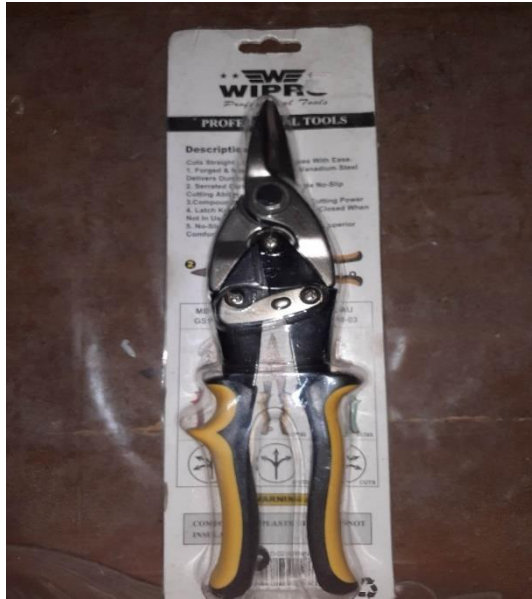
Gambar 3.4.a. Cutter

Peralatan yang telah disiapkan adalah sebagaimana ditunjukkan pada Gambar 4.4a-4.4e.