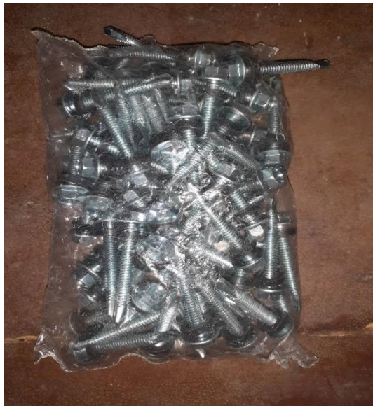
Gambar 3.4.b. Paku seng