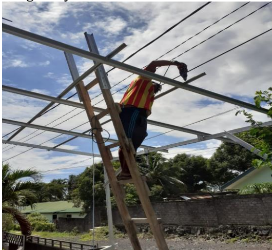
Gambar 3.17. Demonstrasi cara pembuatan garasi atap seng.