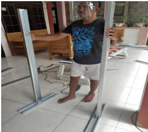
Gambar 3.12. Peserta pelatihan melakukan praktikan dua tiang dengan panjang 1,48 meter, dan 120 cm.