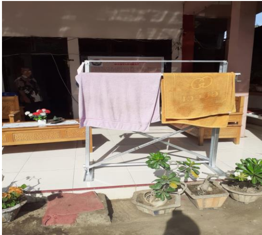
Gambar 3.16. Sudah dapat digunakan dengan layak.