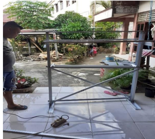
Gambar 3.14 Instruktur selesai memasang skor gantungan handuk untuk penguatan (tidak goyah) .