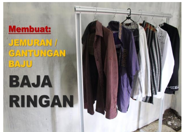
Gambar 1.2. Gantungan baju