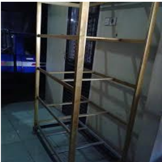
Gambar 1.4. Konstruksi Lemari