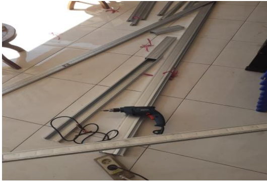
Gambar 3.6. Proses pemotongan baja ringan untuk gantungan handuk