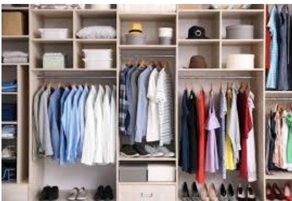
Gambar 1.5. Lemari baju