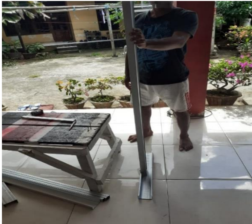
Gambar 3.11. Peserta pelatihan melakukan praktikan satu tiang dengan panjang 1,48 meter, dan 120 cm